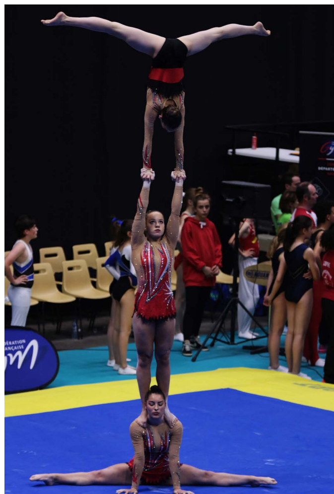
Championnats de France à Albertville (73)