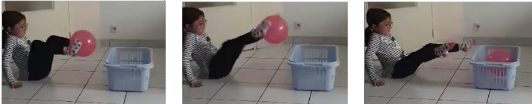
Tireur 3 : lancer une à linge avec ses pieds