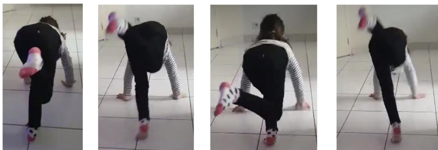
Lapin avec un jambe cassée : un seul pied touche parterre, l'autre jambe reste en l'air