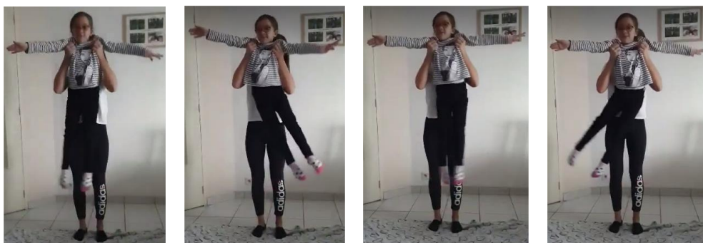
cloche : le parent soulève l'enfant en le portant sous les bras, l'enfant balance ses jambes d'un côté puis l'autre