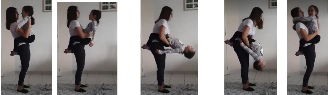
Ouititi : accrocher au ventre du parent, l'enfant se penche en arrière. Le parent soutien le dos de l'enfant