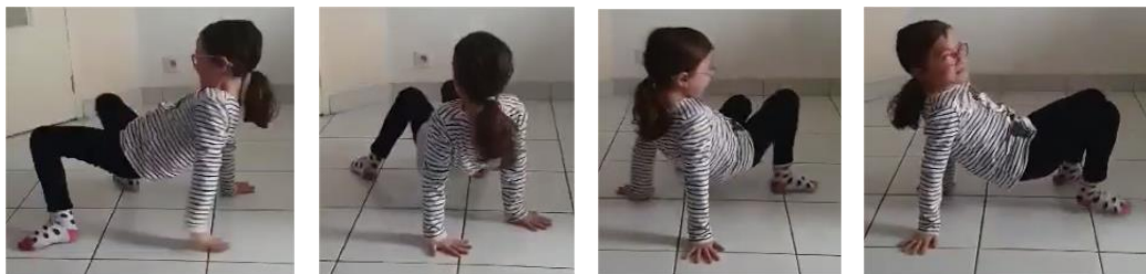
Araignée 3 : se mettre en araignée et tourner comme une toupie, un côté puis l'autre.