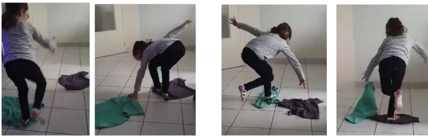
Traversée Rivière : poser 2 chiffons au sol, on pose les pieds sur le 1 er chiffon, on déplace le 2 ème pour avancer, on monte dessus puis on reprend le 1 er pour le déplacer, ainsi de suite