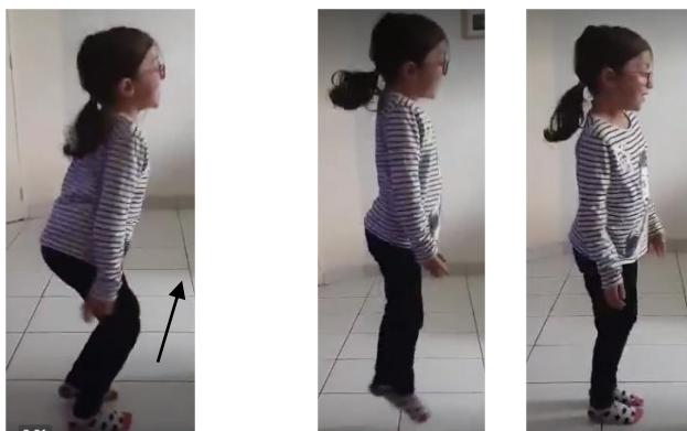
Zébulon : sauter sur le côté pieds joints, d'un côté puis l'autre