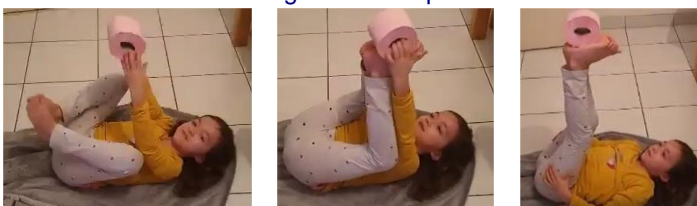
Jongleur 3 : allonger sur le dos, positionner un objet au bout de ses pieds